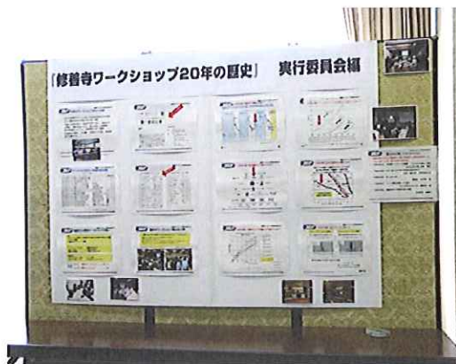
ワークショップ 20年の歴史パネル

また、今回は20回目の開催を記念して、これまでのワークショップの歴史を振り返るパネルを作成し、会場に掲示しました。開催した年々の社会背景と実装技術のイノベーションを反映した内容になっており、これまでに参加された方は懐かしく、今回初めて参加された方には、実装技術の歴史を俯瞰できると大変興味深く見ていただきました。