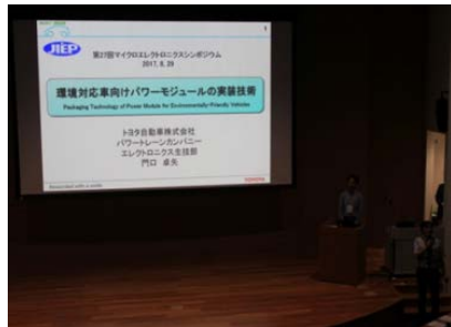
山口 卓矢様 トヨタ自動車株式会社