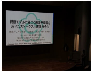
青森 久森様 中京大学