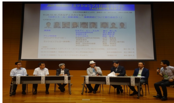
(パネルディスカッション風景)

パネルディスカッション 「ロボット・AI・自動運転... 未来技術について語り合おう！」